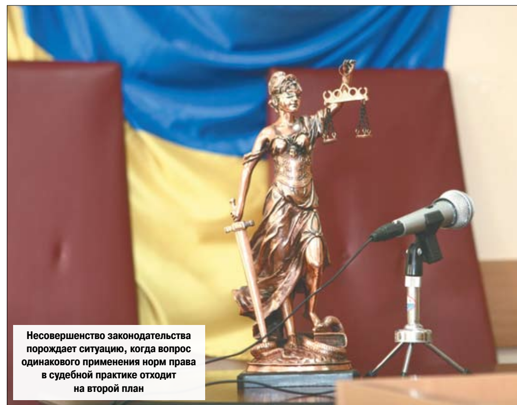
Несовершенство законодательства порождает ситуацию, когда вопрос одинакового применения норм права в судебной практике отходит на второй план

чения ВСУ одинакового применения судами (судом) кассационной инстанции норм материального права. Таким образом, основным является вопрос наличия и достаточности полномочий ВСУ для осуществления данных функций, предусмотренных Законом. Статус наивысшего судебного органа в системе судов общей юрисдикции, установленный для ВСУ Конституцией Украины и Законом, говорит о наличии полномочий. Главная дискуссия разворачивается вокруг вопроса достаточности полномочий у ВСУ для обеспечения в данном случае единой судебной практики. Причем законодатель сделал шаг, как было сказано выше, в направлении расширения полномочий и уточнения некоторых процедурных моментов. Но насколько необходим этот или любой другой шаг без комплексного разрешения ситуации вокруг статуса ВСУ и отношения к высшему судебному органу? Все это может привести к обострению существующей проблемы обеспечения единой судебной практики. →